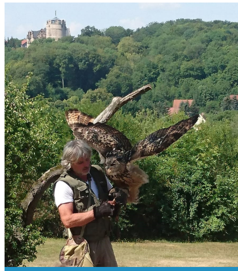
Am Fuß der Niederburg in Kranichfeld

Auf den Spuren des Malers radeln Sie von Dorf zu Dorf und erleben die Wirkungsstätten und Lieblingsmotive Feiningers. Im Jahr 1906 begab sich der amerikanische Maler erstmals nach Weimar um sich dort ein Atelier zu mieten. Über