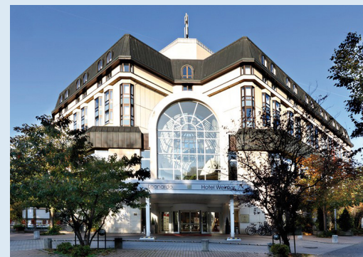
Das Leonardo Weimar liegt nahe der Altstadt