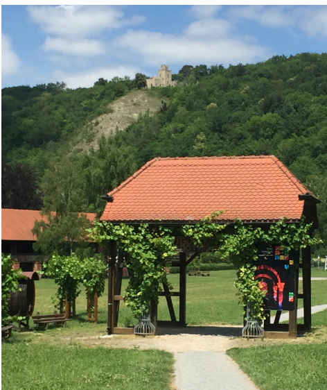
Das Weintor in Bad Sulza

Durch die kürzere Tourvariante können Sie die Reisedauer individuell anpassen. Eine besondere Empfehlung ist die Kombination einer Weimar und einer Erfurt Sterntour. So lernen Sie nicht nur die Landeshauptstadt Thüringens sondern auch die Kulturhauptstadt des Freistaats bestens kennen.