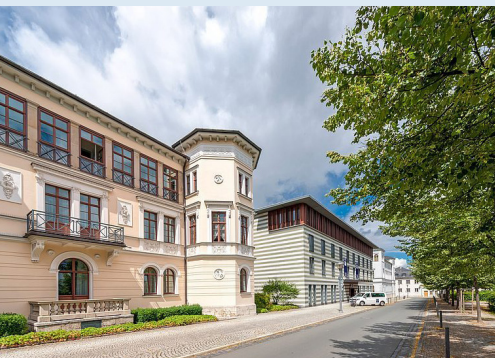
Das Dorint Hotel in Weimar